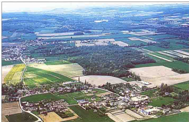
Quel est l'avenir de ma petite forêt ?

Vous êtes propriétaire d'un petit massif forestier, entre 10 et 25 hectares : Vous pouvez déposer un Plan Simple de Gestion Volontaire (P.S.G.) .